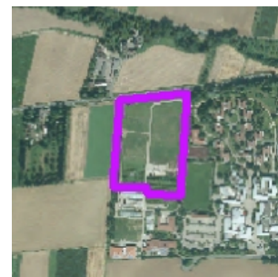
Luftbild Hessen 2012

[3] sehr erheblich ( \geq 0,5 Restriktionen gemittelt über die Fläche)