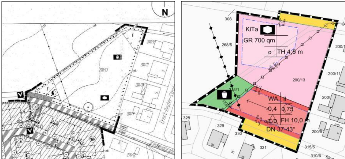
Abb. 2, 3: rechtsgültiger Bebauungsplan Nr. 179 Bindweidgraben; Vorentwurf 03/2018 1. Änd. Bebauungsplan

Die Zweckbestimmung Kindergarten wird im Norden des Areals platziert und erstreckt sich auch auf die Fläche, die bisher dem Aussenbereich zugerechnet wird. Die Berücksichtigung des Spielplatzes geschieht auf einer Fläche zwischen Bebauung und Gartengelände, die nun als Grünfläche ausgewiesen wird. Ca. 1.000 qm, die unmittelbar an die Straße Bindweidgraben angrenzen, werden als Allgemeines Wohngebiet festgesetzt. Die Ausweisung entspricht einerseits der aktuellen Bedarfslage in der Region, sie nutzt darüber hinaus bereits erschlossene Flächen.