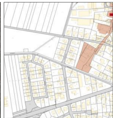
Abb. 7: Umgebung, Denkmalatlas,