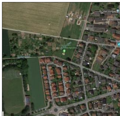
Abb. 6: Umgebung, Luftbild,