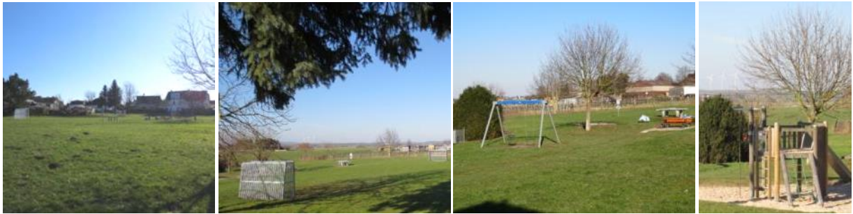
Abb. 8 - 11: unbebauter Geltungsbereich, Bolzplatz, Spielplatz, Spielgerät

Die Fläche ist unbebaut und wird als Spiel- und Bolzplatz benutzt.