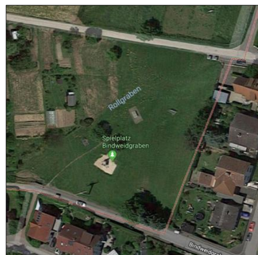
Abb. 2: aktuelles Luftbild, Zugriff am 19.02.2018, ohne Maßstab