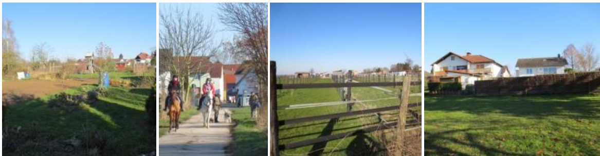
Abb.12 – 15: Kleingärten, verlängerte Freihofstraße, Pferdekoppeln, Nachbarhäuser

Im Süden und Osten schließen sich Wohnbaugrundstücke an, die mit Einfamilienhäusern bebaut sind. Im Norden befinden sich umzäunte Pferdekoppeln. Das westlich angrenzende Areal wird kleingärtnerisch genutzt.