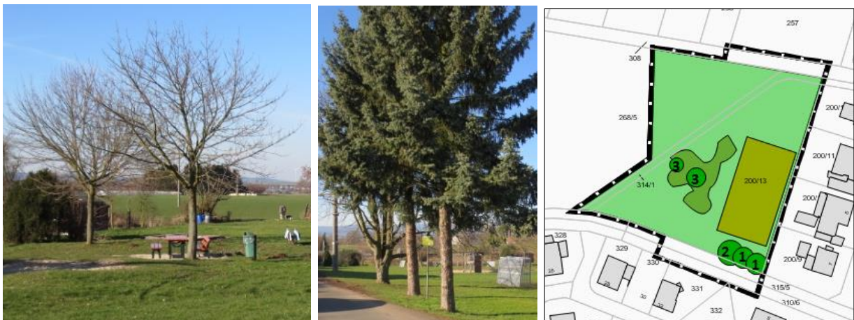
Abb.16 -18: Baumbestand am Spielgerät, an der Straße, im Lageplan

Die Fläche wird im Interesse ihrer Nutzung regelmäßig gemäht und gepflegt. Fünf Bäume befinden sich innerhalb des Geltungsbereiches.