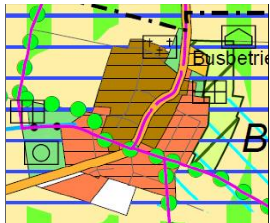
Abb.4: Regionaler Flächennutzungsplan 2010, Ausschnitt Stadt Karben, Burg Gräfenrode

Der Geltungsbereich der Bebauungsplanung wird als Wohnbaufläche dargestellt, die von Regionalparkkorridor durchzogen und von einem überörtlichen Fahrradweg tangiert wird.