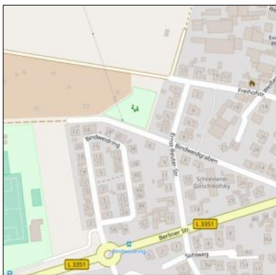
Abb. 5: Umgebung, OpenStreetMap, alle ohne Maßstab

Östlich des Ortsrandes und des alten Ortskerns befindet sich die Fläche, für die die 1. Änderung und Ergänzung des Bebauungsplanes Nr. 179 Bindweidgraben vorgenommen wird.