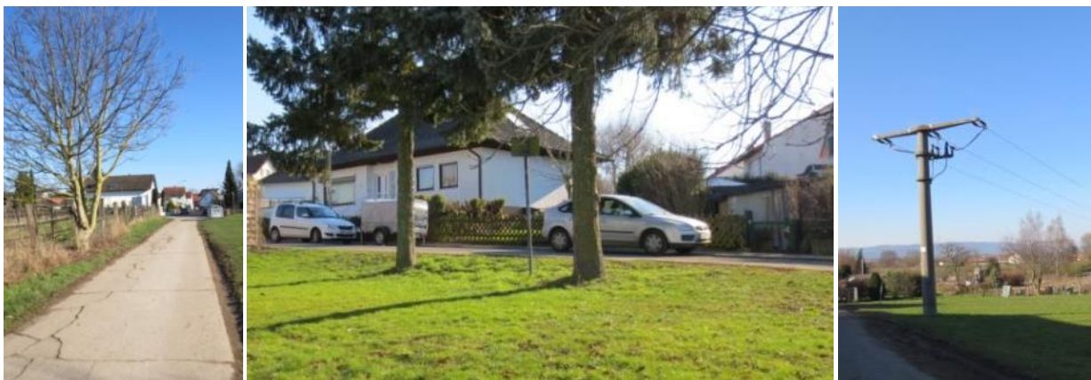
Abb.19 -22: verlängerte Freihofstraße, Bindweidgraben, Strommast

Der Geltungsbereich wird im Norden durch die Verlängerung der Freihofstraße begrenzt, im Süden durch die Straße „Bindweidgraben“, die die angrenzenden Baugrundstücke erschließt.