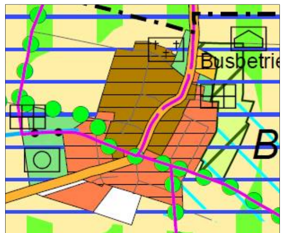
Abb.4: Regionaler Flächennutzungsplan 2010, Ausschnitt Stadt Karben, Burg Gräfenrode

Der Geltungsbereich der Bebauungsplanung wird als Wohnbaufläche dargestellt, die von Regionalparkkorridor durchzogen und von einem überörtlichen Fahrradweg tangiert wird.