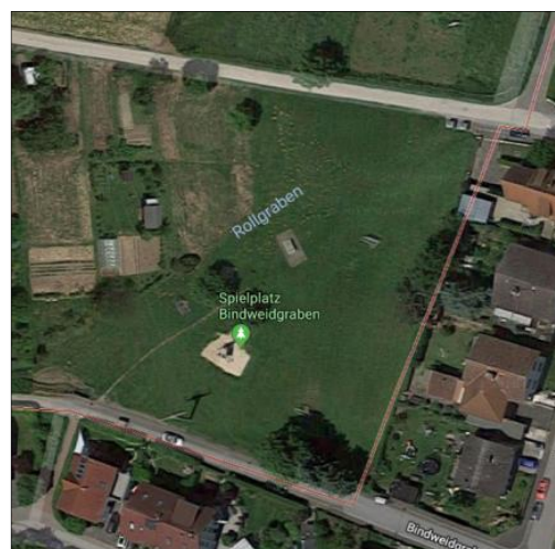
Abb. 2: aktuelles Luftbild, ohne Maßstab