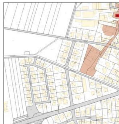
Abb. 7: Umgebung, Denkmalatlas,