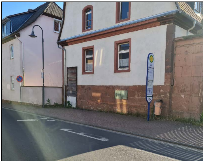
Bushaltestelle „Okarben Kirche“ in Richtung Gartenstraße

Die Bushaltestelle wird unter anderem von Schülern genutzt, um zur Kurt-Schumacher-Schule zu kommen. Zurzeit gibt es jedoch keinen Unterstand, der vor Regen schützen könnte.